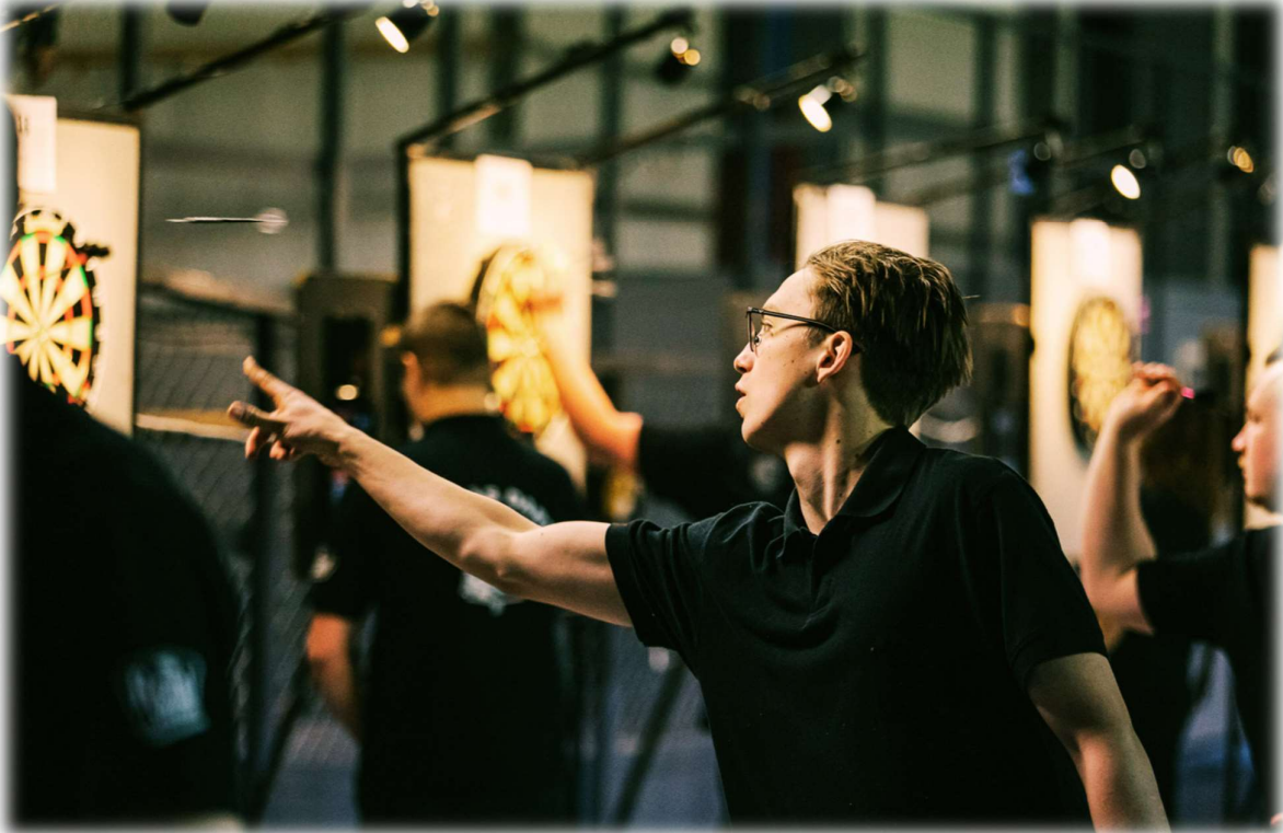
SM I DART UPPSALA 2023