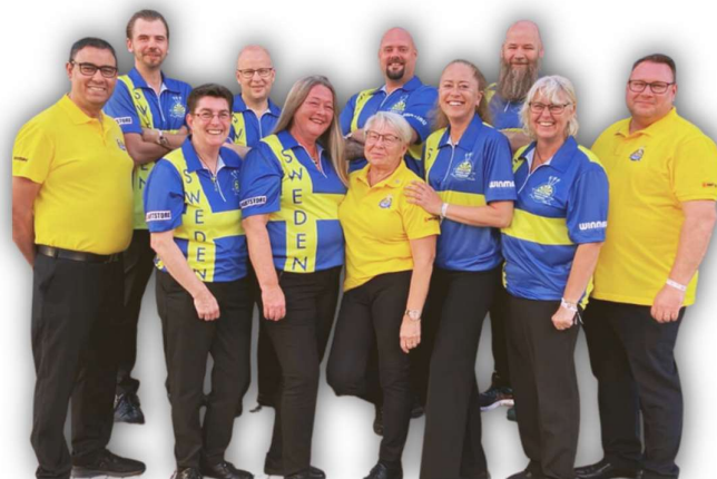
LANDSLAGET I EM 2022

På SM kan alla licensierade spelare delta utan kval. Sweden Cup är SM för lag och arrangeras av SvDF i samarbete med SDF ojämnta spelår, man tävlar med separata herrlag och damlag.